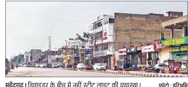
महेंद्रगढ़। डिवाइडर के बीच में नहीं स्ट्रीट लाइट की व्यवस्था।

पार्षदों ने कहा कि नांगल चौधरी नपा को 13 वार्डों में विभाजित किया गया है। पिछली बैठक में वार्ड वाइज विकास कार्य करने की रूपरेखा बनाई गई थी। अधिकांश कार्यों को सुवीकृत कर लिया, लेकिन वर्क अप्रूवल की प्रक्रिया अटकी हुई है। कुछ वार्डों में बीते काल से लगातार सड़क निर्माण, पाइप लाइन तथा गड्ढों में मिट्टी भरने का काम चल रहा है, जिसको पार्षदों ने भेदभाव पूर्ण कार्यशैली करार दिया है। वहीं सात आठ वार्डों में बीते करीब एक साल से विकास कार्यों के लिए एक ईंट तक नहीं लगी। आमरास्तों में गहरे गड्ढे तथा जलभराव की समस्या बनी हुई है। कुछ समस्याओं के एस्टीमेट स्वीकृत हो चुके तथा नपा को बजट भी उपलब्ध करवा दिया है, बावजूद वर्क प्रक्रिया अटकी हुई है। समस्या से चेयरपर्सन प्रिया सैनी के ससुर को अवगत कराया गया था, लेकिन उन्होंने राजनीतिक कारणों का तर्क देकर समाधान करने से इंकार कर दिया। जिससे आक्रोशित पार्षदों ने हाउस की बैठक में शामिल होने से इंकार कर दिया। नौ अक्टूबर को प्रस्तावित बैठक में नारनौल, निजामपुर व नारनौल रोड के दोनों तरफ नाले व टाइलों की सड़क निर्माण पर चर्चा होनी थी। इसके अलावा रिटायर्ड पटवारी को अनुबन्ध पर रखने, डीजल बेल्ट विकसित करने, नपा कार्यालय के लिए निजामपुर रोड पर स्थित कॉलेज की जमीन खरीदने, सफाई के लिए जेसीबी मशीन का प्रबंध, कर्मचारियों को समान काम समान वेतन देने पर विचार विमर्श होना था, लेकिन पार्षदों का बहिष्कार होने पर नपा सचिव को हाउस बैठक स्थगित करनी पड़ी है।