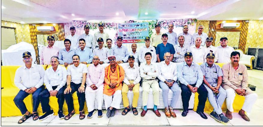
नारनौल। कार्यक्रम के दौरान एक्स एयर वारियर्स एसोसिएशन के सदस्यों।