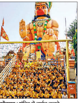
महेंद्रगढ़। मंदिर में दर्शन करते विद्यार्थी।