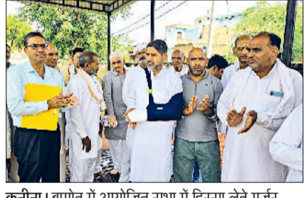
कनीना। बागोत में आयोजित सभा में हिस्सा लेते गुर्जर समाज के प्रतिनिधि।