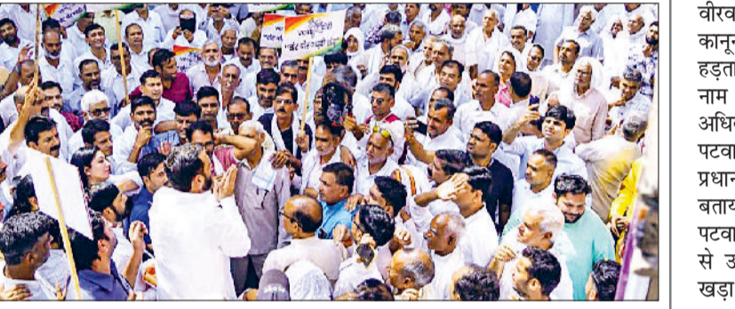
महेन्द्रगढ़। शहर में रोष मार्च निकालते कांग्रेस कार्यकर्ता।