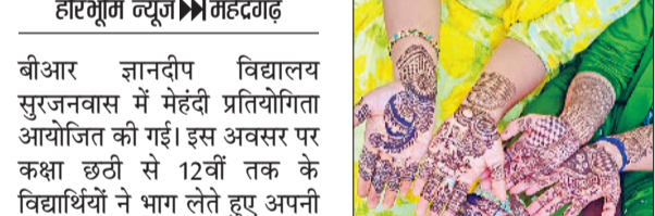
महेंद्रगढ़। हाथों पर लगाई हुई मेहंदी दिखाती हुई।