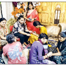
कनीना। ब्यूटी पार्लर में हाथों पर मेहंदी लगावती महिलाएं।

ब्यूटी पार्लर पर महिलाओं की रही मीड कनीना। करवा चौथ के पर्व पर ब्यूटी पार्लर पर महिलाओं की जमकर भीड़ रही। वहां पर महिलाओं ने हाथों पर मेहंदी लगवाने सहित साज सज्जा के सामान की खरीदारी की। पति की लंबी आयु के लिए महिलाओं की ओर से करवा चौथ का व्रत रखा जाता है। इस त्योहार पर महिलाओं द्वारा श्रृंगार व मेहंदी रचाने जैसे कार्य किए जाते हैं। रात्रि को चांद देखने के बाद व्रत खोला जाता है।