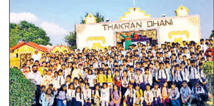
महेंद्रगढ़। भ्रमण करते विद्यार्थी।