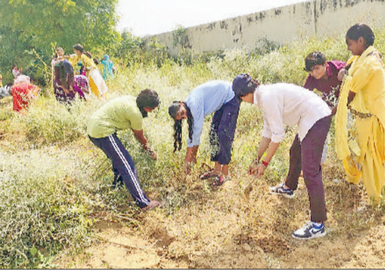
सतनाली मंडी। एनएसएस कैप में सफाई अभियान चलाते स्वयंसेवक।