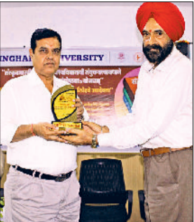
नारनौल। मुख्यअतिथि को सम्मानित करते हुए।

राफेल, सुखोई-30 एमकेआई, मिराज-2000, तेजस, अत्याधुनिक सी-17 ग्लोबमास्टर व अपाचे हेलिकॉप्टर जैसे आधुनिक युद्ध विमान हैं, जो इसे किसी भी परिस्थिति में तुरंत कार्रवाई करने में सक्षम बनाते हैं।