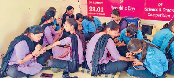
महेंद्रगढ़। मेहंदी प्रतियोगिता में भाग लेती छात्राएं।